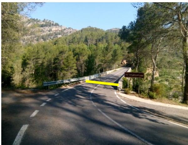
Salida 38,500 CV-190